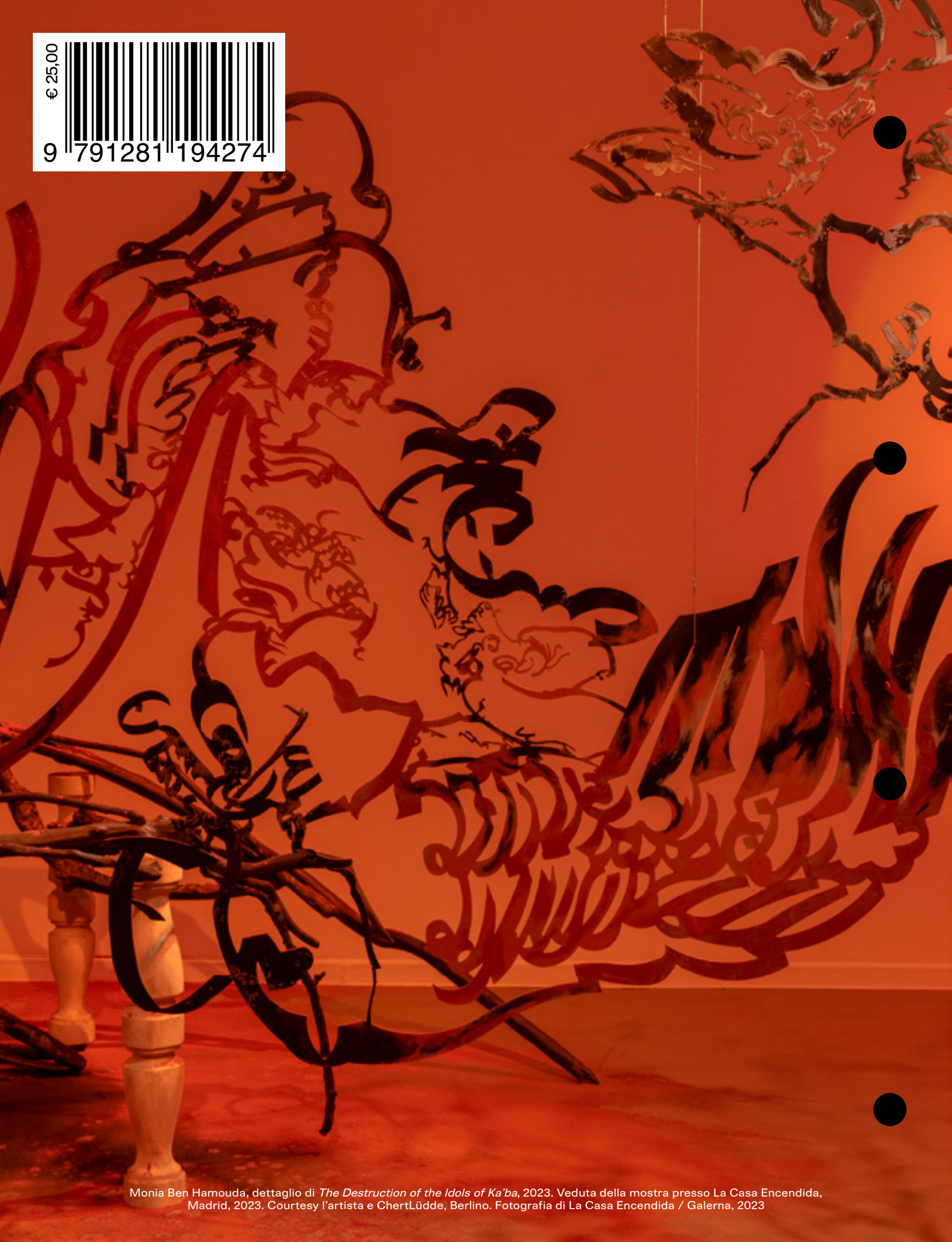
Monia Ben Hamouda, dettaglio di The Destruction of the Idols of Ka'ba , 2023. Veduta della mostra presso La Casa Encendida, Madrid, 2023. Courtesy l'artista e ChertLüdde, Berlino. Fotografia di La Casa Encendida / Galerna, 2023